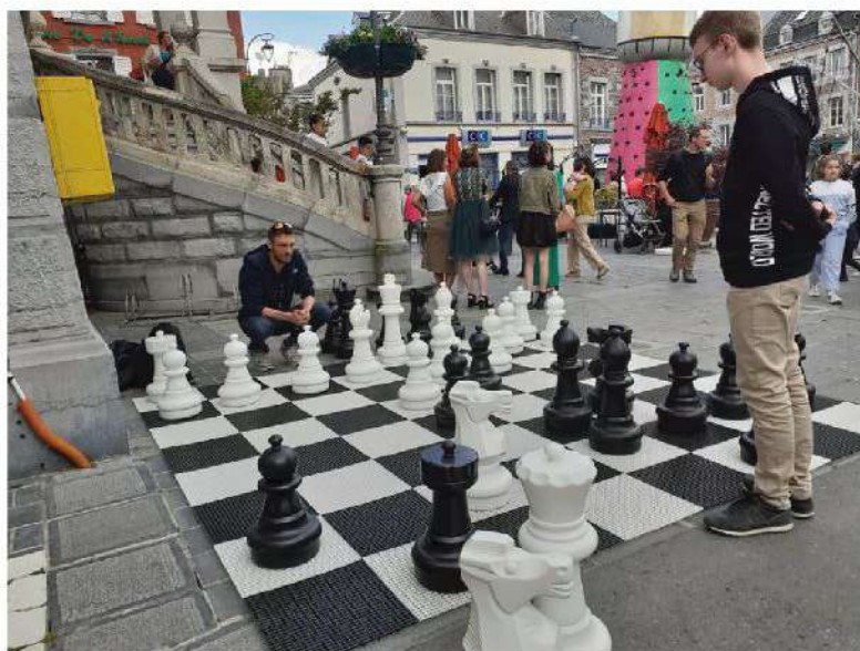
Fête du jeu, place Carnot