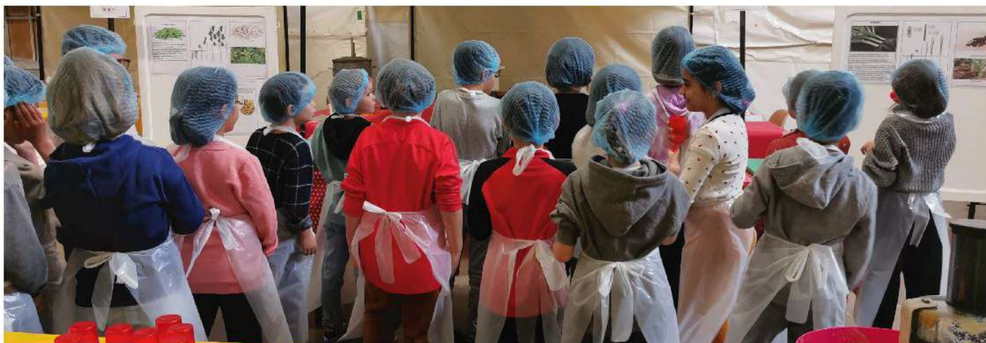
Semaine du goût à l'ancienne Église des Récollets