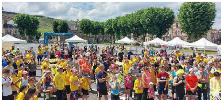
Au départ d'Ardenn'Orientation, place Méhul

Dans le cadre du Téléthon 2022, le samedi 3 décembre, quatre villes se sont associées pour organiser une marche de 9 km reliant la Halle de Chooz à la salle du Richat à Fromelennes via Rancennes et Givet. Une première depuis l'organisation de cette traditionnelle randonnée. Deux cents personnes ont pris le départ !