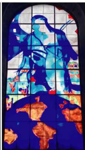
Marie, Mère de l'Humanité