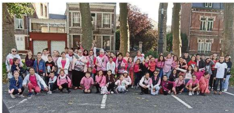
Au départ de la Marche Rose, place Méhul