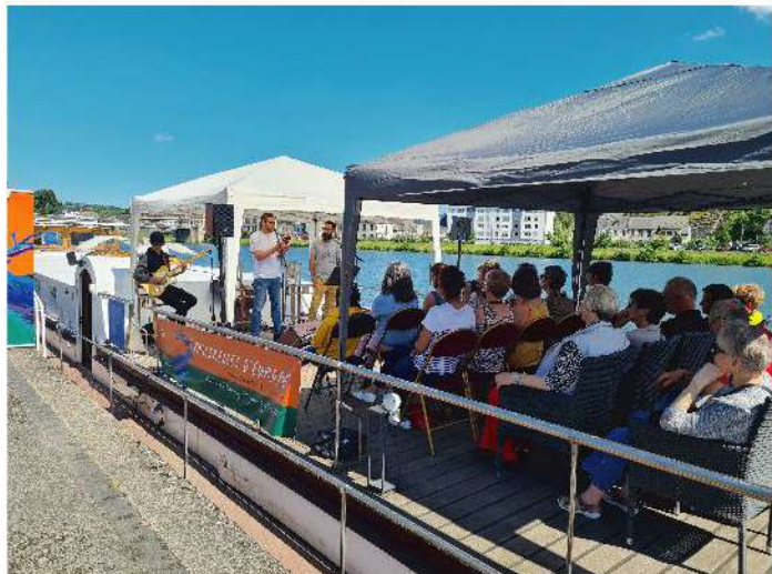
« Passerelles d'Europe », sieste littéraire sur la Meuse

Les croisiéristes ont pu partager une expérience unique, poétique et musicale sur les quais des Fours.