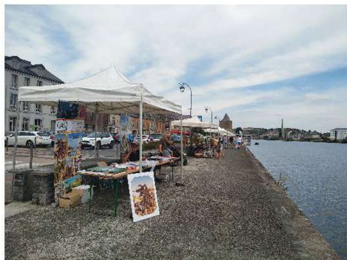
Rencontre des Arts, Quai des Fours

C'est le dimanche 14 août, le long des Quais que les différents artistes nous ont exposé leurs oeuvres d'art. Professionnels et amateurs se sont côtoyés pour le plus grand plaisir des Givetois. Peintres et artisans s'étaient donné rendez-vous pour une rencontre des Arts en bord de Meuse.