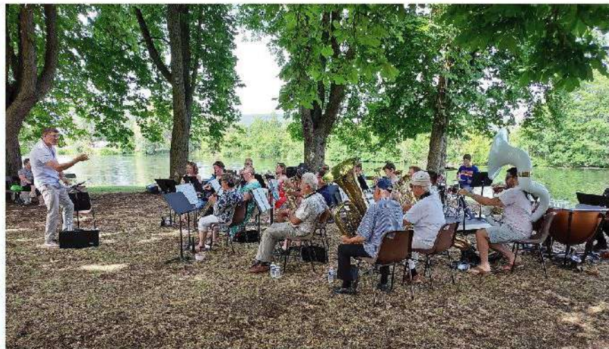
Harmonie Municipale de Givet, square Bon-Secours