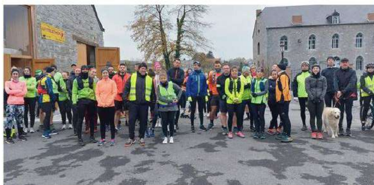
Les coureurs du Téléthon, salle de la Halle à Chooz