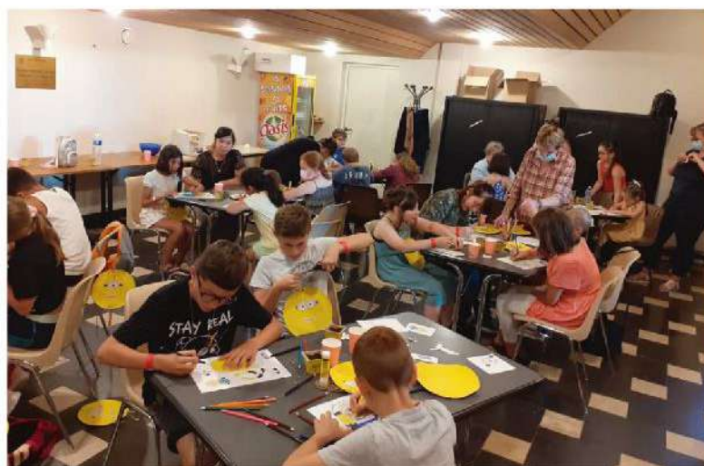
Après-midi récréative au Manège

Au programme : projection d'un film d'animation ou dessin animé (en fonction des films à l'affiche), activité bricolage sur un thème approprié, et goûter. Les places sont limitées et se réservent très vite. Alors soyez vigilants sur les dates des futures après-midis récréatives !